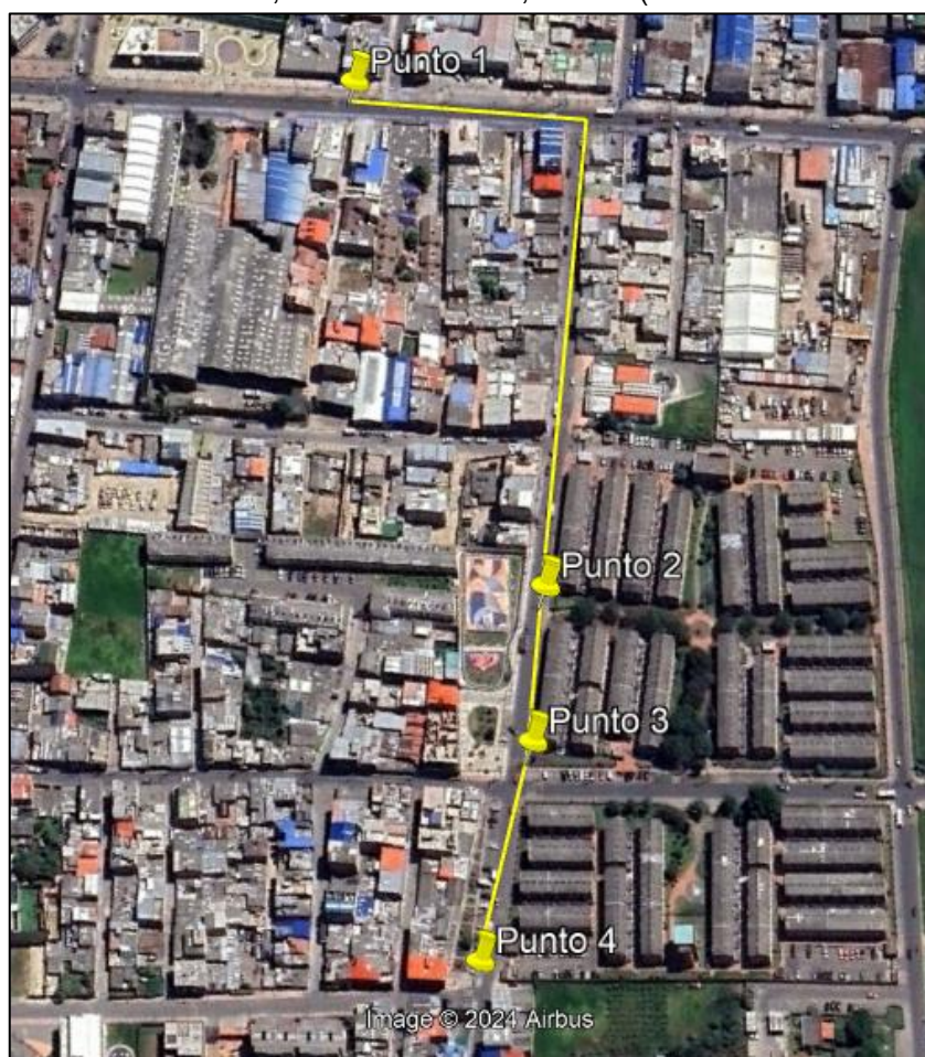
Ilustración 1. Recorrido verificación ambiental

Con base en lo anterior, el día 11 de octubre de 2024 se realizó recorrido de control y vigilancia en el barrio Serrezuelita desde las coordenadas 4°42'31,512"N- 74°12'23,188"W hasta las coordenadas 4°42'23,128"N- 74°12'32,425"W (ver ilustración 1. Ruta amarilla).